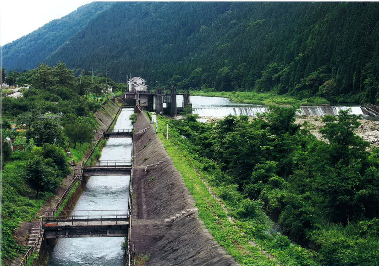
白山市白山町地内「白山頭首工」(宮竹用水・七ヶ用水合同取水口)