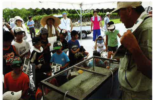
とれた魚についての勉強会