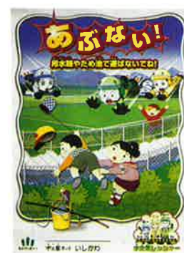
全国土地改良事業団体連合会が制作した転落防止を呼びかけるポスター