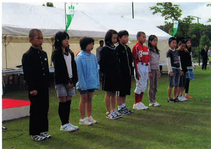
受賞された皆さん