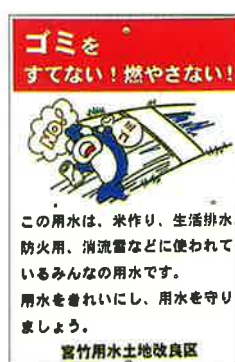
ゴミ投棄防止を呼びかける看板

幹線水路への通水に伴う各支線水路への水嵩も増す時期となりました。各地区を流れる用排水路への転落事故防止（特にお年寄りや小さなお子さんのおいでの方で、付近に水路が流れている方はご注意ください。）と水路へのゴミ及び築堤の草等を捨てないようにお願い致します。