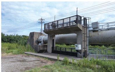
【宮竹用水地区】 (逆サイフォン呑口水門他)