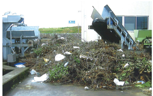
小松市安宅町地内 梯川右岸第1排水機場 (不法投棄により排水機場に流れてきたゴミ)