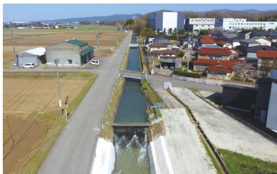
【得橋地区】 (得橋用水路)