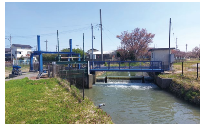
【西川地区】 (三反田水門)