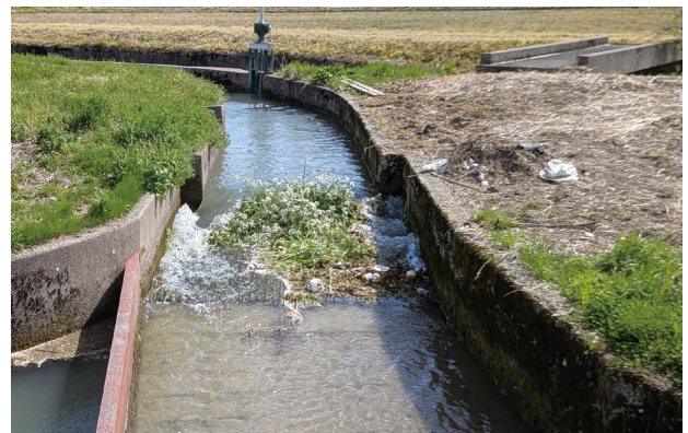
能美市湯谷町地内 釜谷用水路 (上流から流れてきた野菜くず)