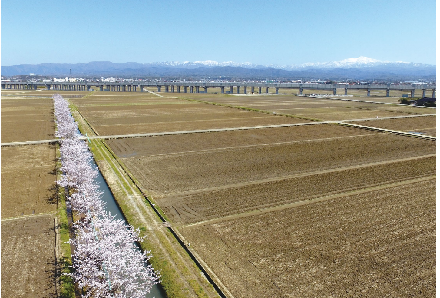
西川用水と桜並木（背景は白山の山並みと北陸新幹線）【能美市中ノ江町地内】