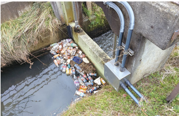
能美市東任田町地内 根上用水門 (不法投棄により水門前に詰まったゴミ)