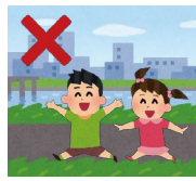
水路の近くで遊ばない