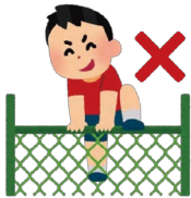
フェンスに登らない