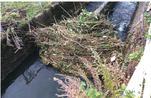
能美市五間堂町地内 西川・根上用水分岐点 (上流から流れてきた草)