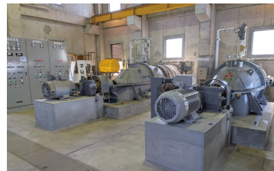
【佐野地区】 (佐野排水機場)